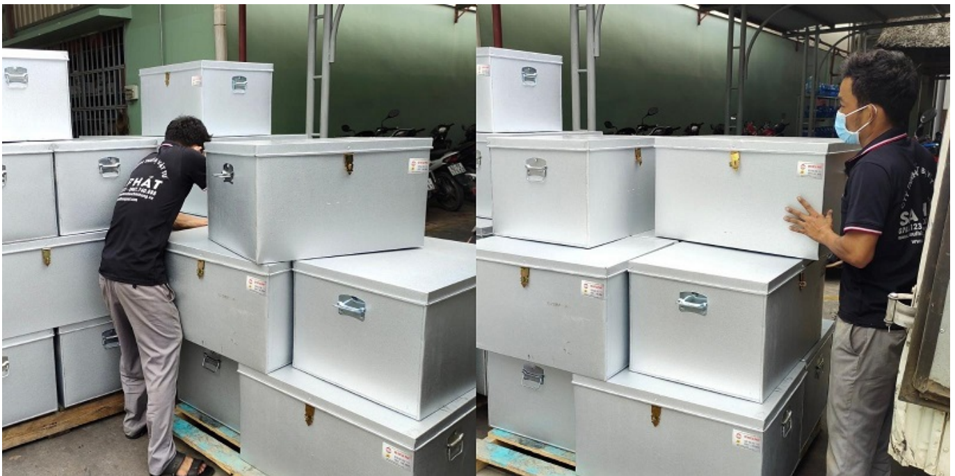
Thùng nhôm s? - giá sử dụng

Ngoài những kích thước trên, quý khách có thể yêu cầu sản xuất làm theo nhu cầu của mình. Kích thước, màu mã khác nhau, quý khách hàng nên chọn mua thùng theo nhu cầu sử dụng, diện tích văn phòng. Không nên mua thùng nhôm s? quá lớn, bỏ tài liệu quý thùng sử dụng đến tình trạng khó vận chuyển